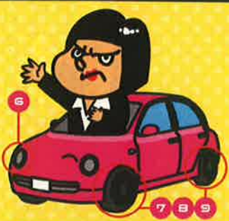
クルマの周り 4項目