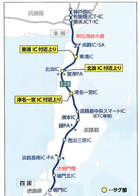
E28 神戸淡路鳴門自動車道