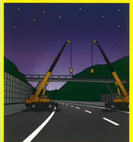
※イメージです。 高速道路に跨ぐ橋梁を撤去します。