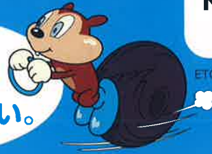
ETCナビゲーター「スピディ」