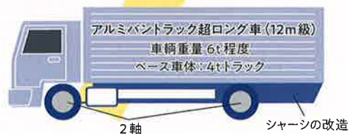
【強風により横転しやすい車の特徴車(イメージ図)】

2~4トン積のアルミバン搭載のトラックで空荷のときは、重心が高く横風の影響で横転する可能性が非常に高くなります。走行には十分に注意していただきますようお願い申し上げます。特に図のような超ロング車(12m級)は、無理なご走行は事故を誘発し、大変危険です。