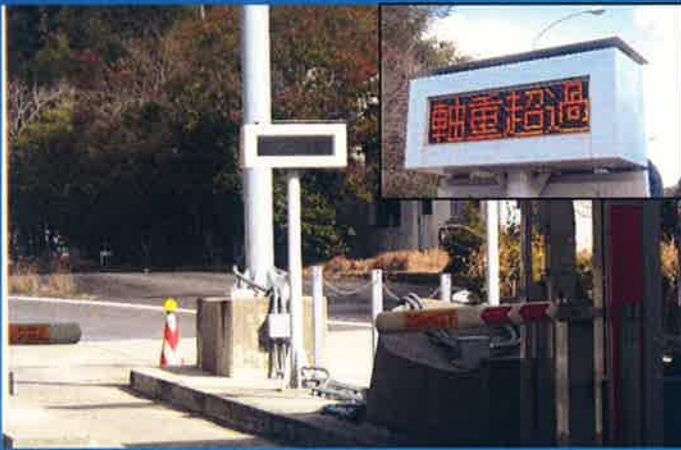
料金所での「軸重超過」表示