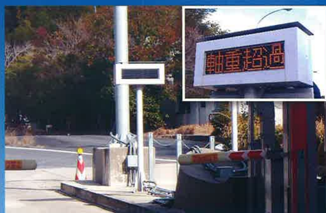
料金所での「軸重超過」表示